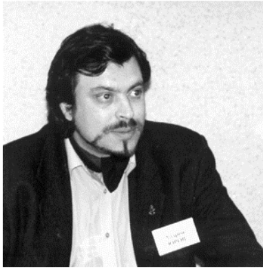
ЮРОВ АНДРЕЙ ЮРЬЕВИЧ эксперт Совета Европы